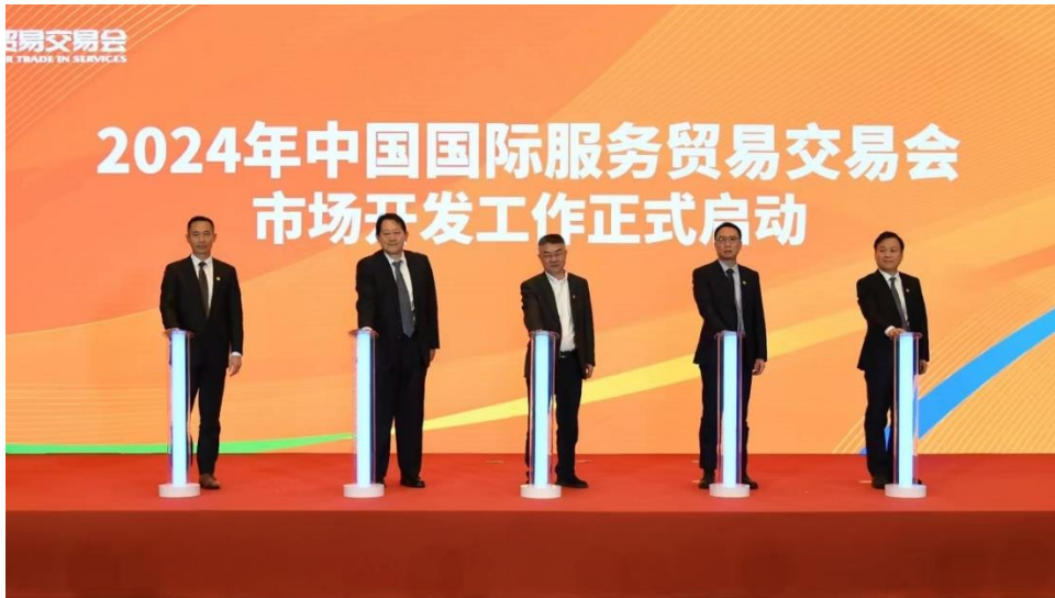
2024 年中国国际服务贸易交易会市场开发工作启动仪式现场。

北京市商务局领导、北辰集团及首都会展集团相关领导，各合作企业、机构代表及媒体参加活动。